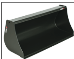
Bak 1,40 m