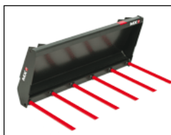
Mestvork 1,20 m