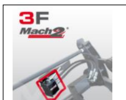
Mach 2 systeem