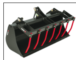
Multi-service bak 1,30 m