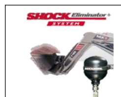
Schok eliminator systeem