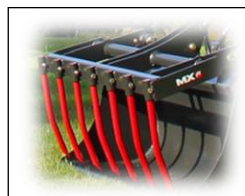
Mestvork klauw GFC120