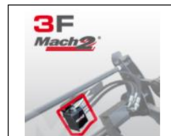
Mach 2 systeem