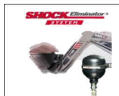
Schok eliminator systeem